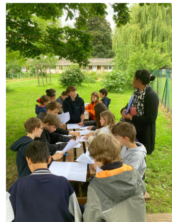
Cours de Maths au vert avec les 6èmes