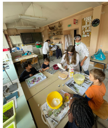
Ateliers scientifiques conduits par les élèves de 2nde auprès des CP et des CE2

Les élèves de 2nde ont passé 2 jours à Stuttgart, visité la ville, découvert l'école chrétienne (qui compte 1400 élèves) et retrouvé les amis de la conférence GCSN. Viviane Oberli, professeur d'anglais.