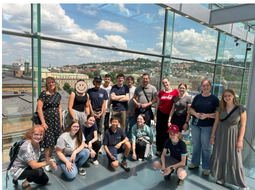
Les lycéens en sortie à Gérardmer.