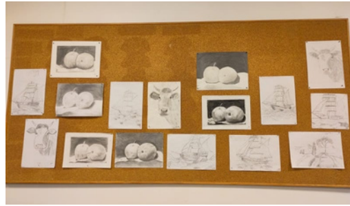
Dessins des élèves au réfectoire.

Intervention des gendarmes sur le harcèlement